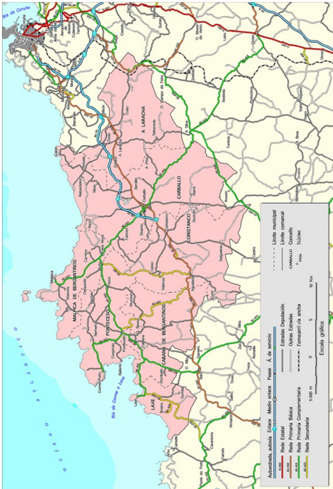
SITGA: MAPA DE DETALLE E INFRAESTRUTURAS DE TRANSPORTE